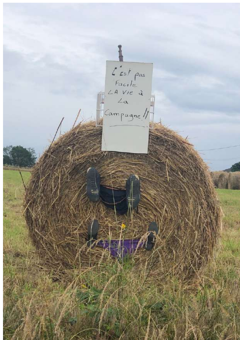
Réalisation: Angélique Puechberty Photo commission communication Photo associations