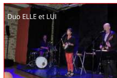
Duo ELLE et LUI